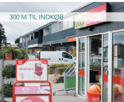
300 M TIL INDKØB