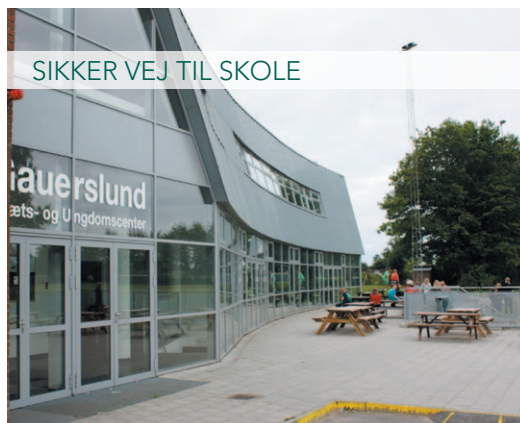
SIKKER VEJ TIL SKOLE