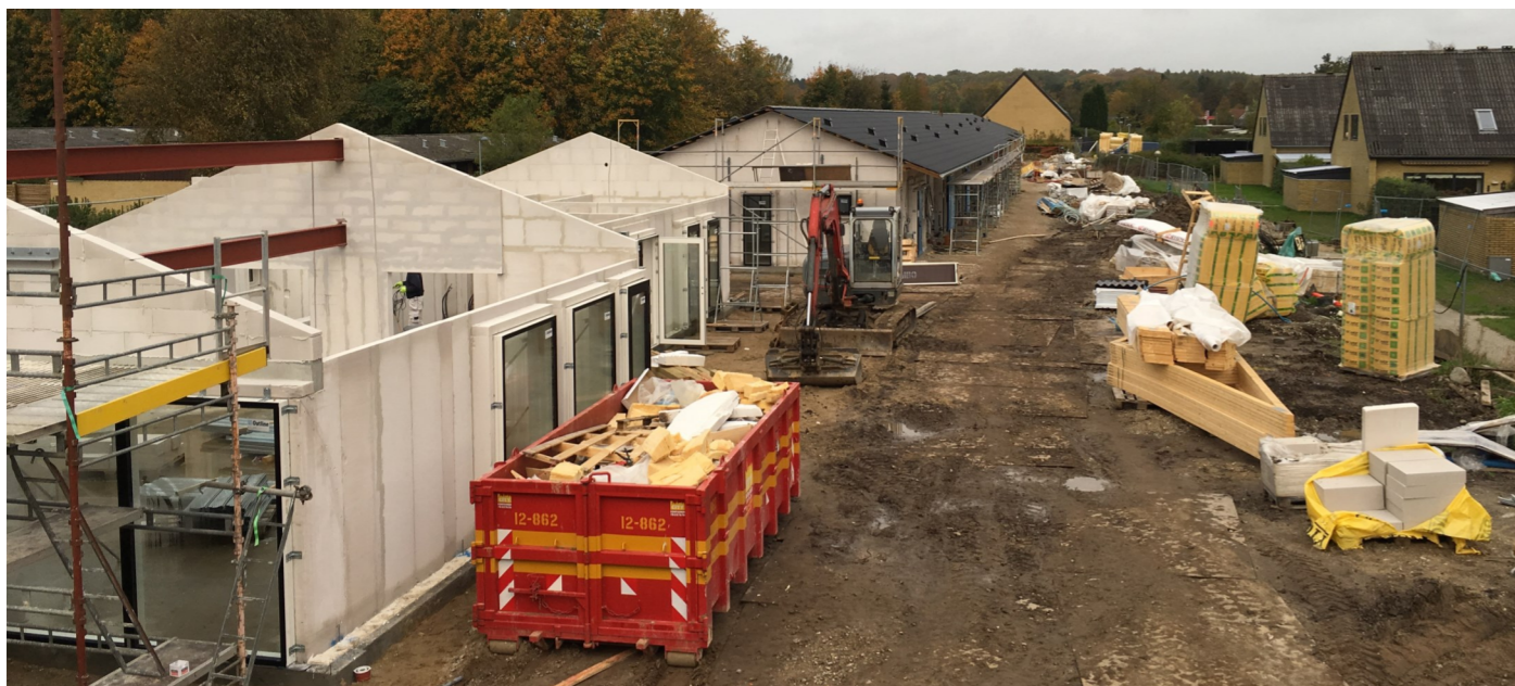
Byggeriet skrider planmæssigt frem, til trods for det noget fugtige vejrlig.

Vinduer og døre er isat, og der monteres spær i uge 42.