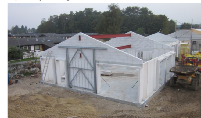
Fælleshuset er støbt og bagmur og skillevægge er opsat. Spær rejser i uge 42.