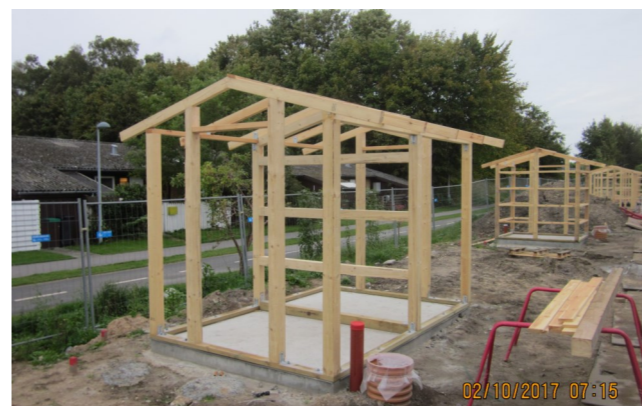
Der udføres udhuse til hver bolig.