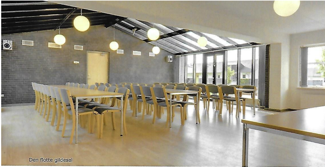
Den flotte gildesal