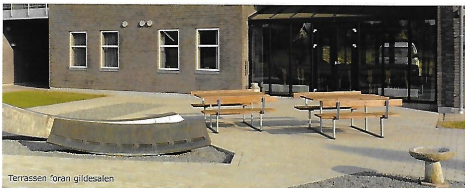
Terrassen foran gildesalen